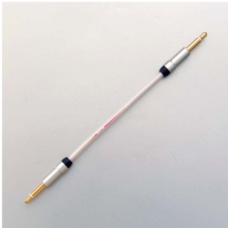
coxc_01_3232 3.5 2p - 3.5 2p silver plated PCOCC foamed PE insulation aluminum tape + copper shield pvc jacket gold plated plug aluminum sleeve length:0.1m jan:4534165012661

銀メッキPCOCC導体、同軸デジタルケーブル(coaxial)。 ケーブル部分は、特性インピーダンス75Ωの設計。